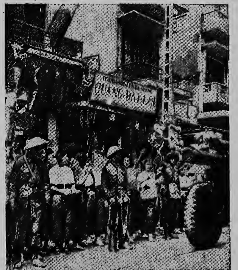
THE COMMUNIST VIETMINH ARMY takes control of the city of Hanoi Indo-China, in accordance with terms of the armistice with France. Schoolchildren stay behind footsoldiers as a mechanized column rolls down the street. Red agitators were held responsible for stirring up a mob along the Hanoi-Haiphong railroad to stone French soldiers leaving the area with military equipment.